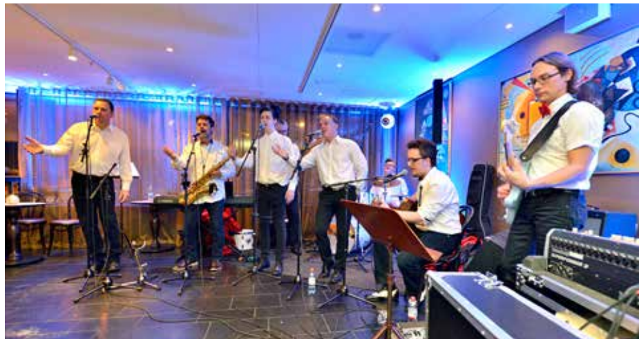
Quality Hotel stod för ett gediget program med olika aktörer under tre dagar.