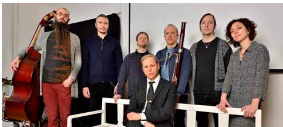
Fantastisk föreställning med bild och musik om gågna tider med lokala musiker.