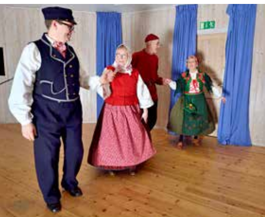
Prova på dans och uppvisning på Dansens hus av Gellmalaget, Dundretbuggarna och Tangoföreningen.