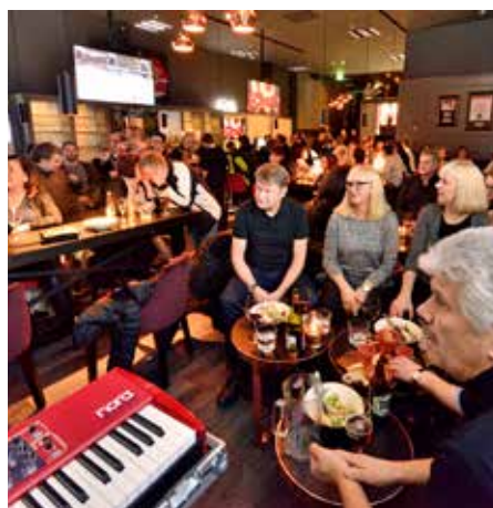
Härlig soul och rockmusik under Afterski på Quality Hotel.