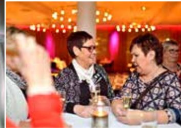
Det fanns tid för mingel med kollegorna innan tre-rättersmiddagen serverades.