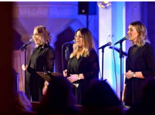
Sånggruppen Harmonize uppträdde bl.a. i kyrkan på lördagskvällen.