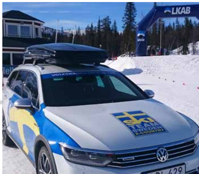
Volkswagen Tour Gällivare Lapland 30 mars - 2 april 2017

Efteråt väntar prisutdelning och After Ski på Quality Hotel Lapland.