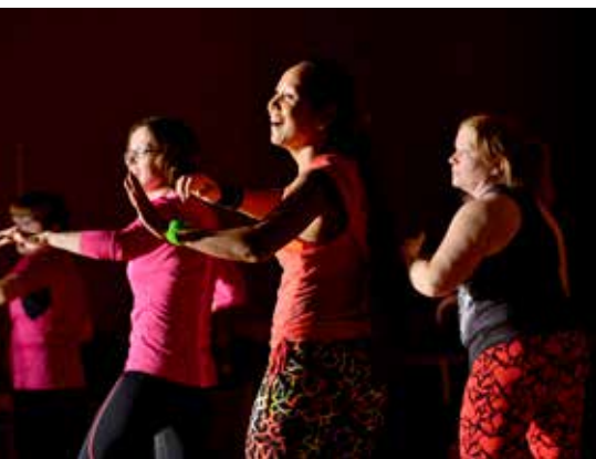
Drop In Zumba i Sjöparks skolan.