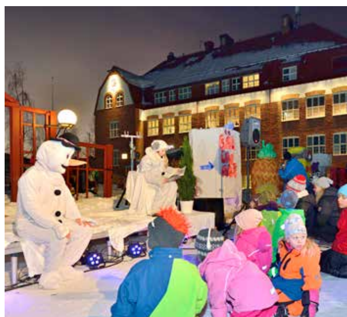
Invigningen tillägnades barnen och skolorna, med snöskulpturer, lek och stoj. Sagoläsning av gubben Snö och gumman Tö.