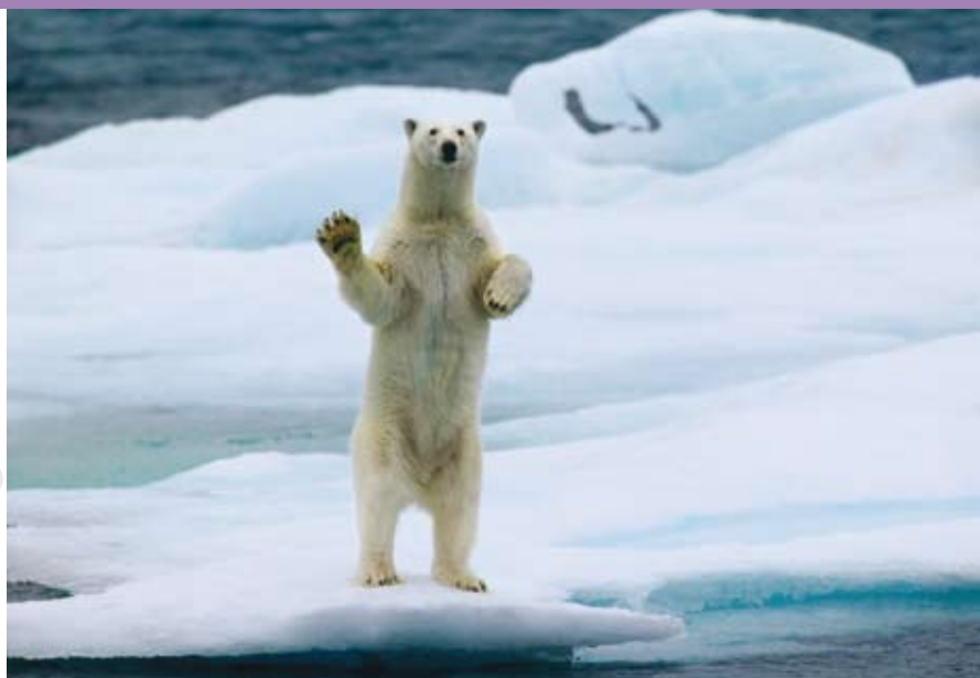
Foto: Vinkande isbjörn