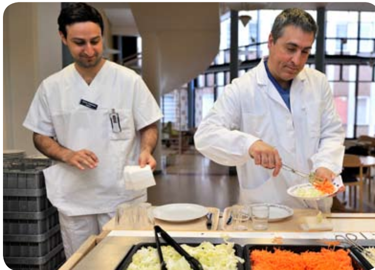
I restaurang Kristallen erbjuds dagligen varmrätt och ett fräscht salladsbord.

-I Sverige ägnar vi tid, kraft och pengar åt att utveckla arbetsmiljön och målet är att alla ska må bra på jobbet. I det perspektivet bör tobaksfria arbetsplatser vara en självklarhet. Livsmedelsbranschens extremt höga hygienkrav verkar i samma riktning och det underlättade vårt beslut.