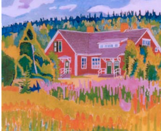
Illustration: Erling Johansson

Ett utförligt programblad kommer att ges ut inför Hemvändarsommaren 2010.