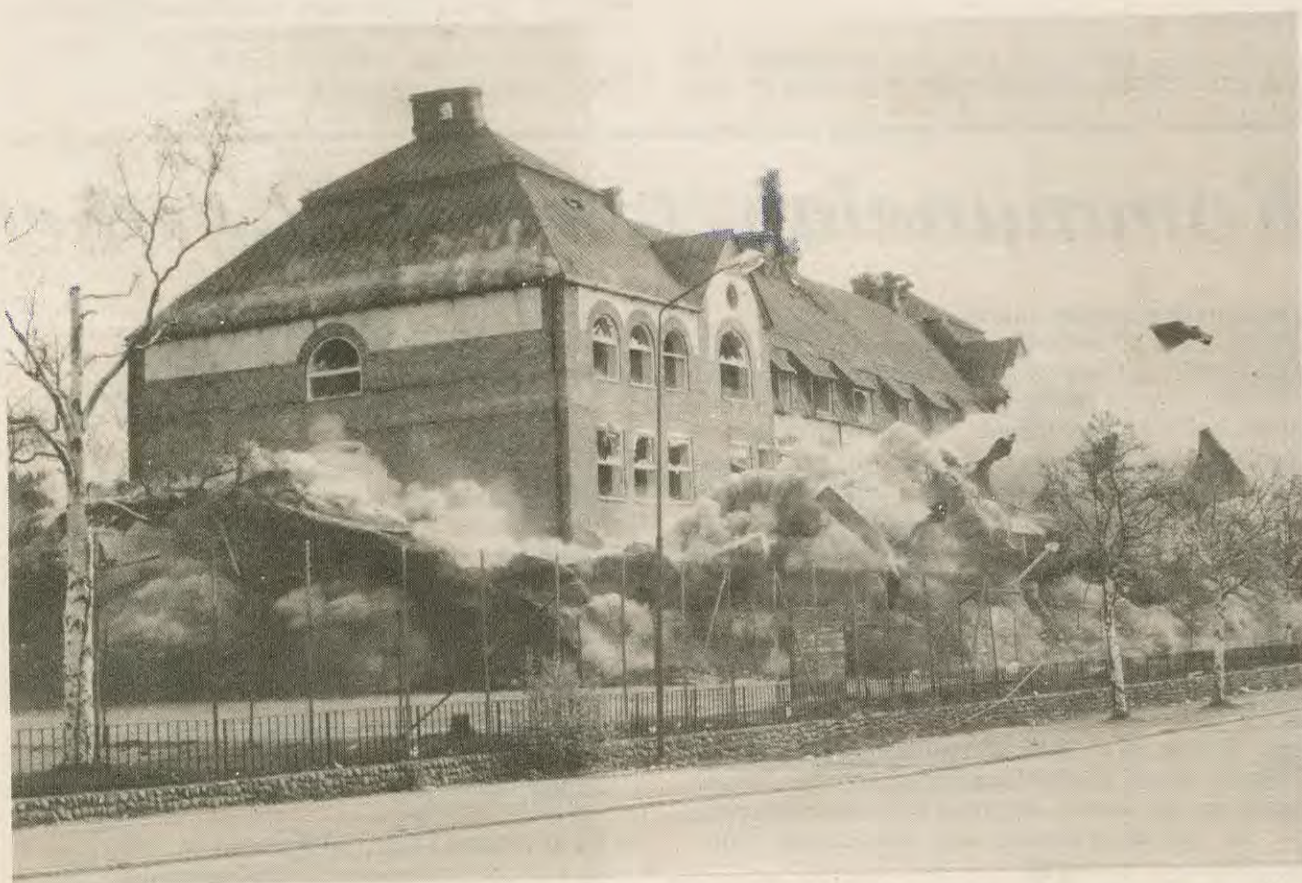
Det är inte bara ekonomiskt som gruvindustrin påverkar samhällsbilden. Malmbergets Centralskola har fått ge

Många av de målsättningarna har kommunen redan idag börjat arbeta med. En särskild näringslivsenhet har inrättats, Gällivareprojektet har kommit igång. En industriförening har bildats. Några av de industriföretag som tidigare arbetade med serviceuppdrag för LKAB har tagit fram egna produkter och startat tillverkning av dessa. Beroendet av LKAB kan minskas succesivt tillsammans med aktiv planering och stöd till det övriga näringslivet.