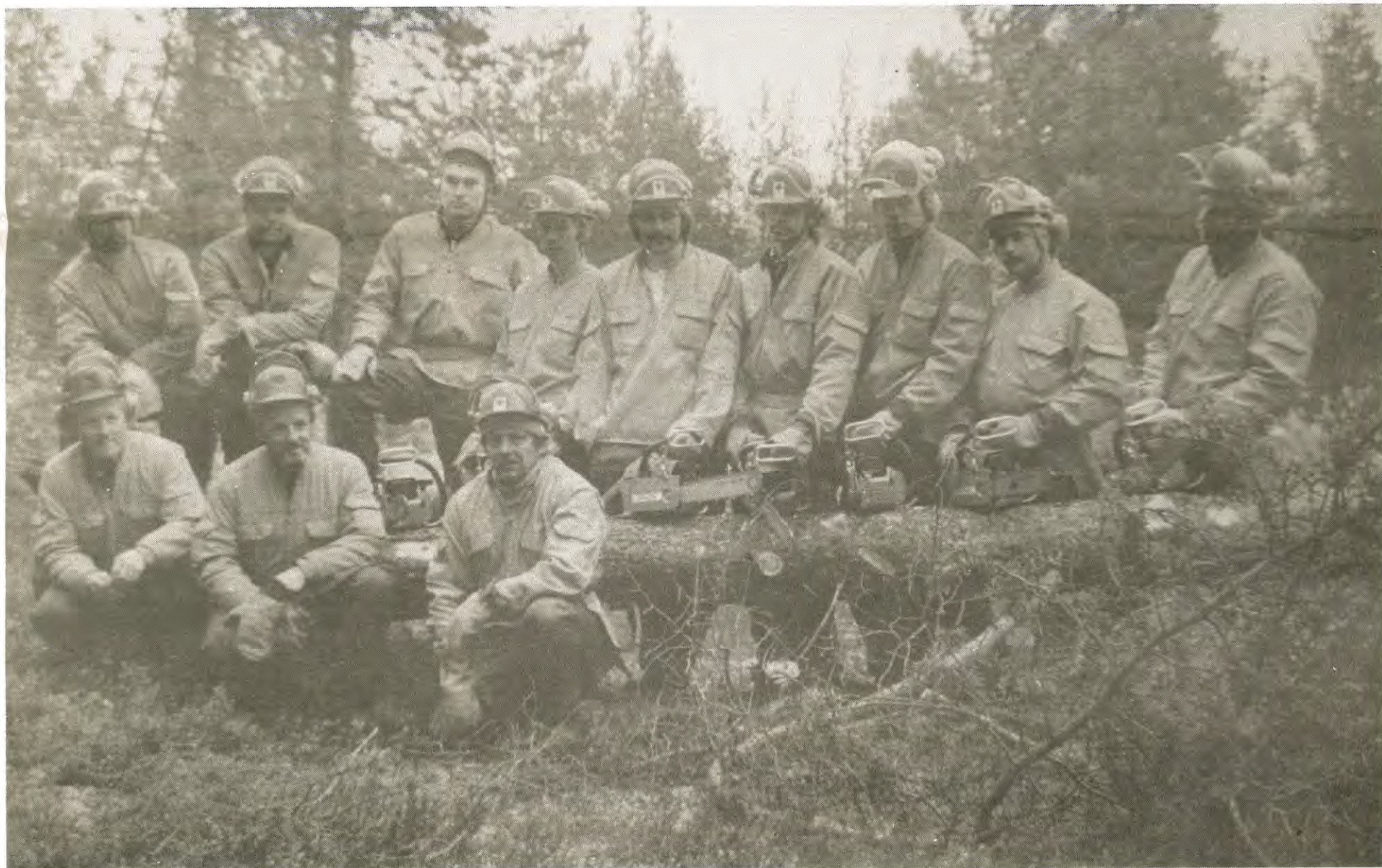
Tystnar allt för många motorsågar på vår landsbygd, tystnar också många av våra byar.