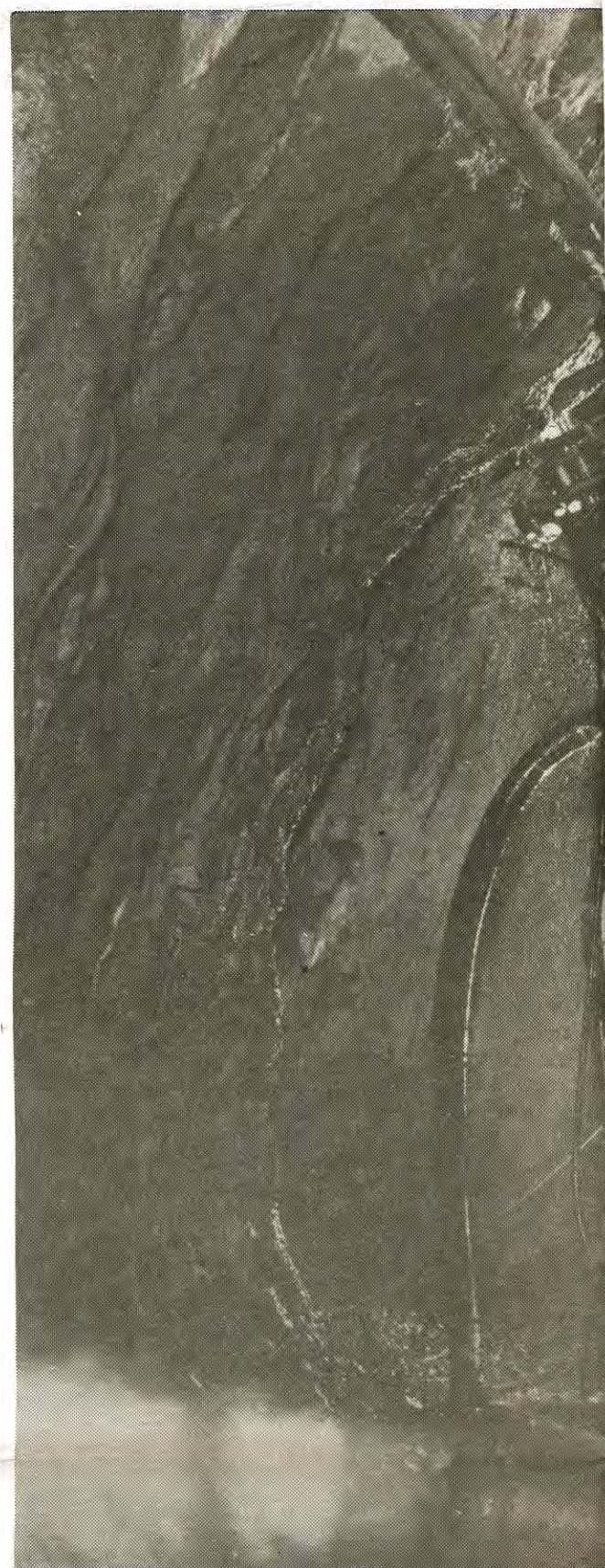
Omkring 2000 människor arbetar idag vid LKAB. Under tiden fram till 1985 behöver LKAB minska sin personalstyrka med ca 300 personer. Bolidens Aitikgruva kommer dock att behöva nyrekrytera personal.

Denna dystra prognos bygger helt på att inga arbetsmarknads-