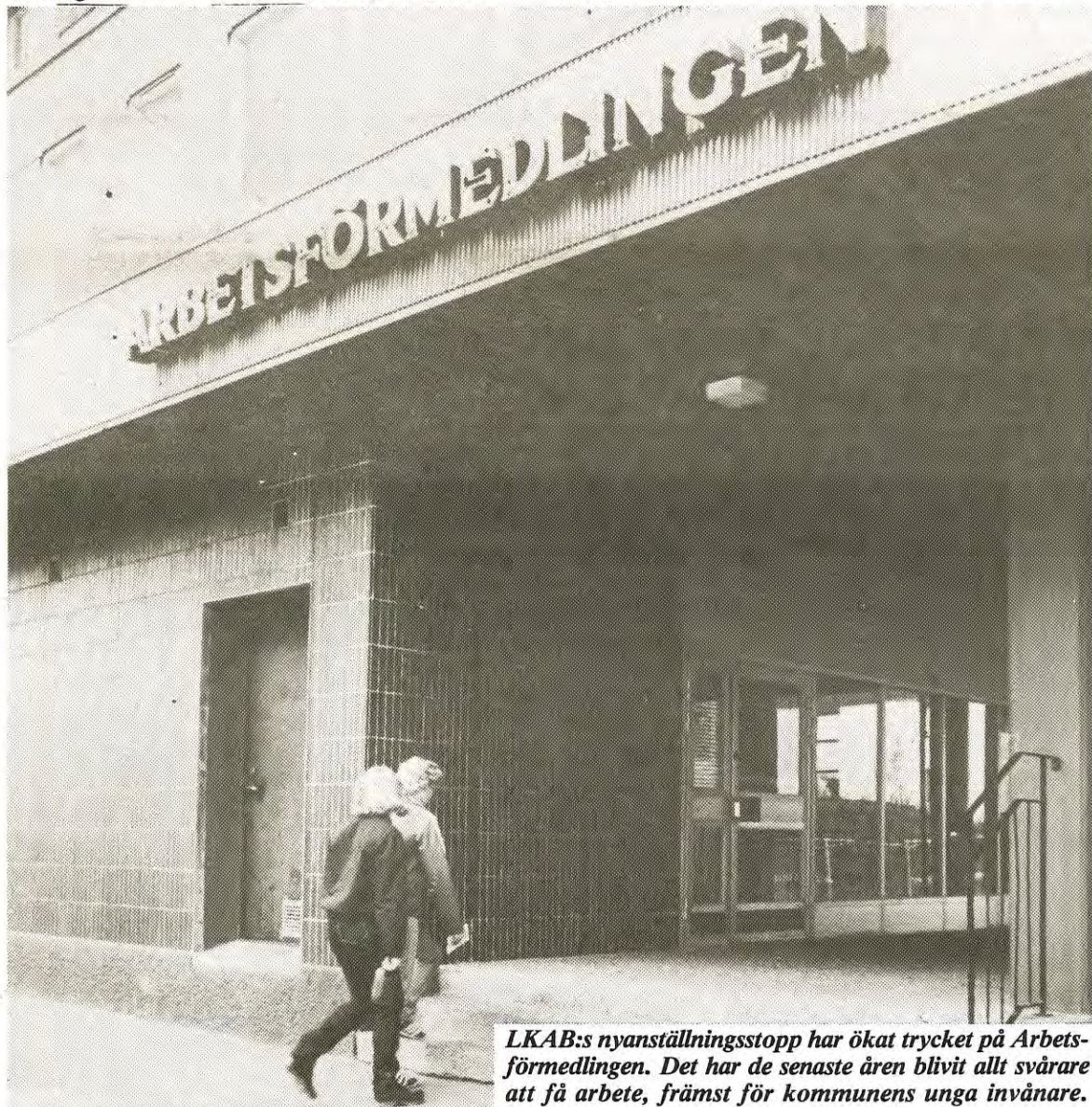
LKAB:s nyanställningsstopp har ökat trycket på Arbetsförmedlingen. Det har de senaste åren blivit allt svårare att få arbete, främst för kommunens unga invånare.

+ 4 av 5 gällivarebor eller 20.000 invånare är antingen direkt eller indirekt beroende av LKAB.