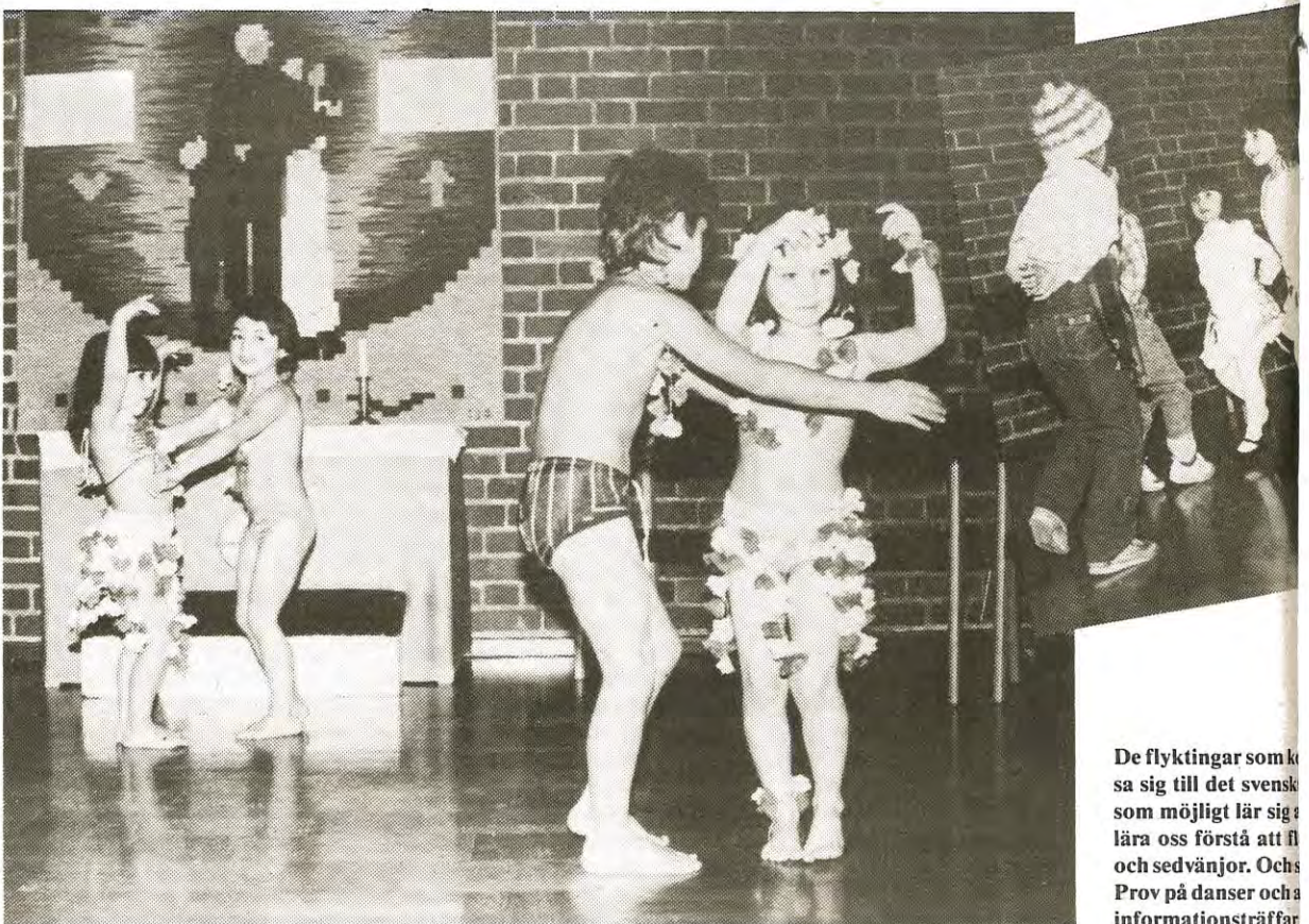
De flyktingar som kommer till Gällivare lär sig så mycket som möjligt om den svenska kulturen och sedvänjor. Och så får de också informationsträffar.