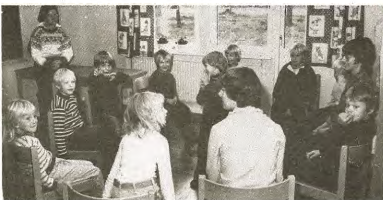
Antalet förskolebarn har minskats från 15 till 11 i varje grupp efter flyttningen.

— En av nackdelarna med flyttningen är att barnen, som är i fem—sexårsåldern, förlorar kontakten med större