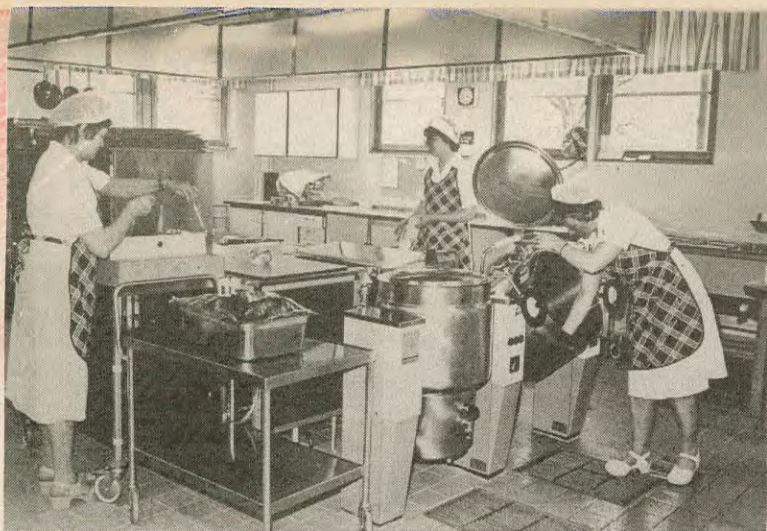
All mat som serveras på Enen är tillagad av personalen i det egna köket.