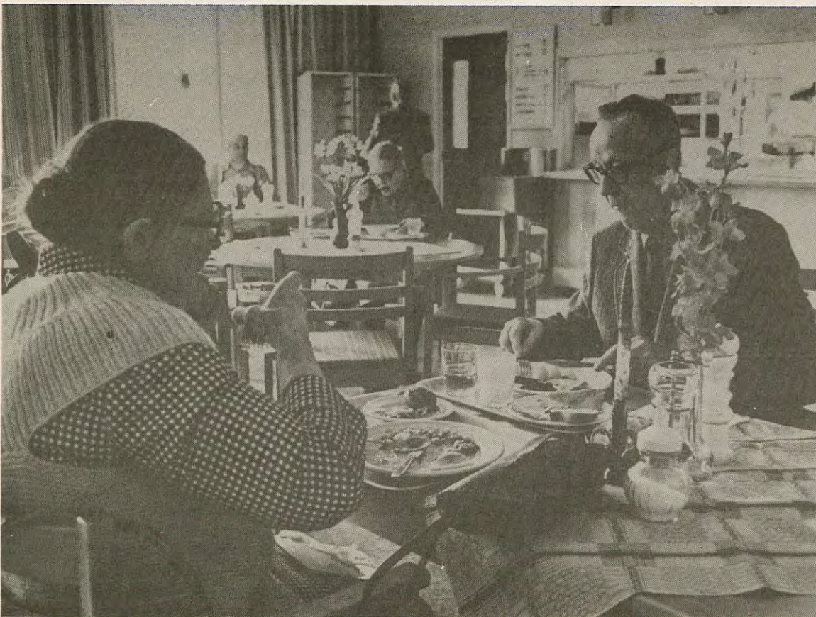
Restaurangen i servicehuset Enen är öppen för alla pensionärer i Gällivare. Man behöver alltså inte bo i huset för att äta på Enen.