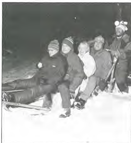
Hundspann vid gamla kyrkan