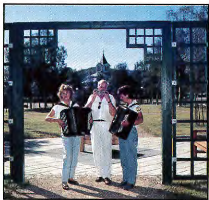
Lördag i Parken välkomnar dig med musik.

Varje lördag kl 11.00 blir det fest i Sommar Gällivare. Det bjuds på elefanter, clowner, agitationstal, palt, jazzdans, musik i alla stilar, Klondike, yxkastning, kortspel, tävlingar, och partipolitik. Allt kan hända under lördag i parken. Äntligen får vi en mötesplats för ung som gammal. Du träffar Gällivarebor, turister, och utflyttare som blir hemvändare. Platsen är vårt nya centrum som får ett namn vid premiären den 11 juni. Avslutning blir den 17 september med val-lördag. Partierna får en sista chans att övertyga dig i en annorlunda tävling.