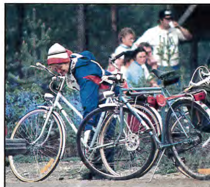
Du åker i din egen takt och tar gärna en paus vid rastplatserna.

I helgen deltog ca 200 cyklister längs linassvängen. Linassvängen är att i fager försommartid få cykla fram på bra vägar men också att sega sig upp för de jobbiga backarna vid Martinvaara, Vähävaara, Satter och Rautakoski. Men Linassvängen är också att njuta av medvinden längs E 10:an. Sen blev det även tid att äta renskav i Dokkas, fil i Ullatti och nypon-soppa i Hakkas.