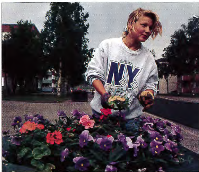
Kommunens trädgårdsarbetare har bråda dagar under juni med att plantera ut 27 000 blommor.