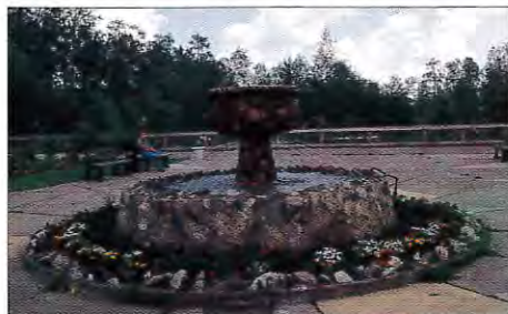
Swan Carlssons fontän är en verklig raritet i Svanparken.

27 000 blommor planteras ut varje sommar i Gällivares parker. Det är ett hårt arbete som ligger bakom utplanteringen av blommor. Men det är dock resultatet som räknas när de vackra blommorna syns i våra parker. Den här sommaren blir det också extra fint i Svanparken i Malmberget.