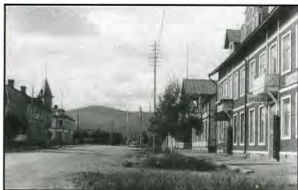
Malmbergsvägen med järnvägsstationen i bakgrunden.

Gällivare har aktiva hundklubbar som varje sommar anordnar stora hundutställningar. Fågelhundar och brukshundar visas upp den 19 juni på Gällivareutställningen. Midsommarhelgen 24-25 juni blir det utställning i midnattssolen. 26 juni får du se vinthundsraser.