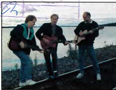
Visavi är en av musikgrupperna som deltar på Musik i fjällvärld.