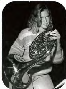
Den alltid så populära musikskolan framträder under Hälsans Dag.

Gympa i fyra olika former, rygg-, motion-, step-up, aerobic. Thai Chi. Boule. Tipspromenad. Klättervägg. Cykelbana. Skateboard.