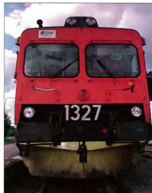
Inlandsbanans chaufför stannar gärna och hämtar dig efter en dags hjortronplockning.

Inlandsbanan går igenom Sjaunjamyren. Gällivares bästa hjortronplatser väntar på dig. Du kan t ex åka på morgonen med Inlandsbanan till myggmuseet eller Kuossakåbba. Myren väntar på dig direkt när du stiger av rälsbussen. Under en hel dag fyller du hjortronhinkarna och på kvällen åker du hem med rälsbussen. Det kostar dig endast 30 kronor tur och retur att komma ut till de bästa hjortronmarkerna i vår kommun. Biljett köper du på rälsbussen.