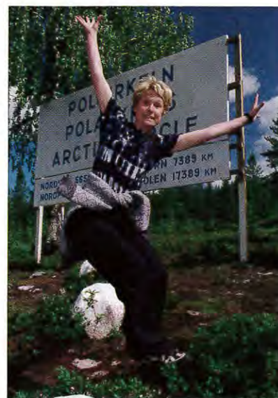
Polcirkeln är en av Inlandsbanans "highlights". Ett hopp över Polcirkeln är ett måste för en turist.