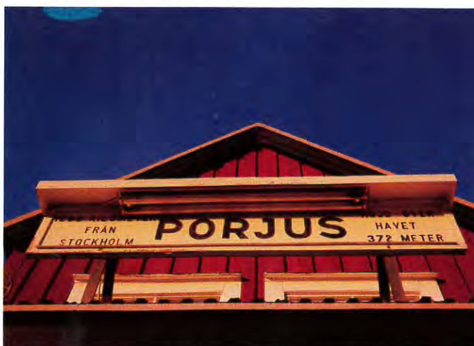
Porjus har mycket att bjuda på under en sommardag. Galleri 47 i stationshuset, gamla kraftstationen, Porjusberget och varför inte en god lunch på hotell Rallarrosen.

I sommar har du som Gällivarebo en stor chans att upptäcka Inlandsbanan. Du kan t ex åka från Gällivare till Sjaunja myggmuseum och vidare till Porjus, Jokkmokk eller Arvidsjaur. Sen åker du tillbaka samma väg. Det blir en dag fylld av upplevelser till en billig penning.