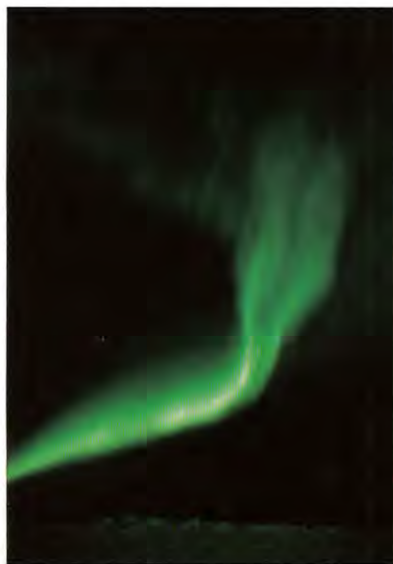
Fotograf Patricia Cowern har utställning av Norrskensbilder i Centralskolans kafé.

Patricia Cowern, fotograf bosatt i Porjus, har utställning av Norrskensbilder på Centralskolans kafé tiden 27 december till 8 januari. Norrskenet är vinterns häftigaste fenomen och missa inte tillfället att se Patricia's fantastiska bilder över vårt norrsken.