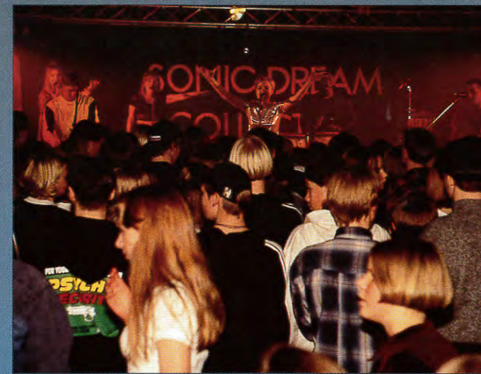
Ungdomarna erbjuds ett nyårsdisco på Stacken i Gällivare.

Ungdomens nykterhetsförbund (UNF) har fått stöd för att anordna ett nyårsdisco på Stacken. Det blir ett s k megadisco med dj: Micke Köhler. Blåskontroll och drogfritt som vanligt. Ingen åldersgräns, gäller för kvällen har UNF meddelat.