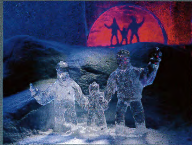
Bilden är sammansatt med förgrundsfamiljen, bakgrundshimlen och solen skulpterade ur isblock från Abborrtjärn och fjället Dundret formad i snö. Motivet är belyst med färger som återspeglar den lappländska vintern.

Vi bjuder på invigning av invigning av isskulpturer, barns framtid, nyårspatrullen, fyrverkeri, nyårsdisco samt festligheter i många av Gällivares byar.