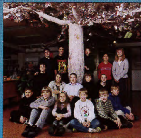
16 skolelever får under nyårsaftonen pris för sina bilder i miljökalendern.

Kl 17.00 blir det fyrverkeri i Sjöparken. Vi har valt en eftermiddagstid så att alla skall ha chans att få uppleva ett färgsprakande fyrverkeri. Platsen blir Sjöparken eftersom det är en säker plats och publiken får bra utsikt över fyrverkerierna. Vi bjuder även på trivsamt stämning med islyktor, eldar och varm förtäring. Parkera gärna din bil i centrum.