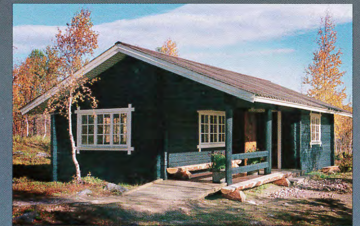
I Killinge blir det nyårsfest i Fallets Stuga.

Gällivares byar kommer att fira millennium på olika sätt. Skröven serverar nyårsbuffé med underhållning och lekar i Mikkelsgården. Den nya byastugan invigs i Sakajärvi. Killinge firar i Fallets stuga med en supé. Palohournas startar firandet kl 12.00 då de går 2000 meter och lämnar året 1999 bakom sig. Det blir även festligheter i Käantöjärvi, Nattavaara, Hakkas, Dokkas, Sammakko-Lillberget, Tjautjas och Markitta.