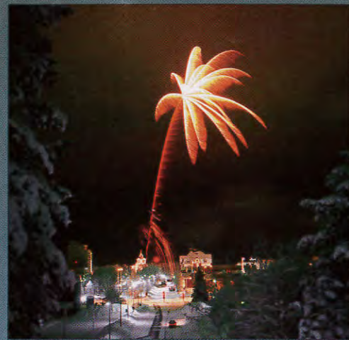
Gällivares fyrverkeri avskjuts kl 17.00 från Sjöparken.

Miljökalendern har sänts till alla hushåll och väckt en stor nyfikenhet. Nu visar vi även alla övriga teckningar och de ger en bra bild över skolelevers tankar inför framtiden.