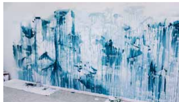
Sidoprojekt, en påbörjad väggmålning av Maria Winbjörk.