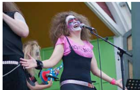
Noctum Rectum uppträder i Svanparken på en av sommarens trivselkvällar.