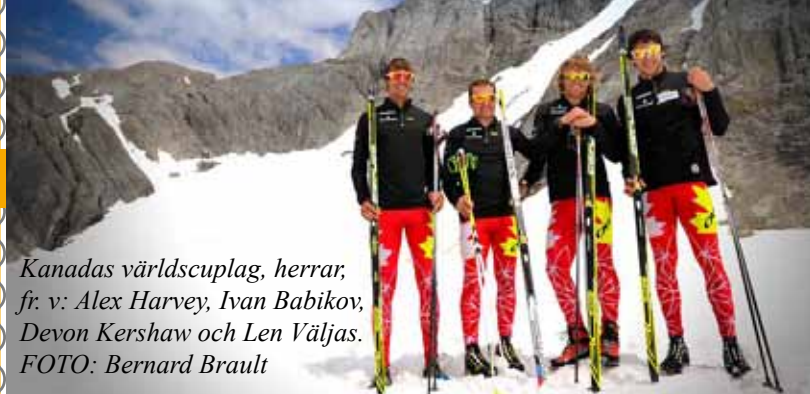
Kanadas världscuplag, herrar, fr. v: Alex Harvey, Ivan Babikov, Devon Kershaw och Len Väljas.