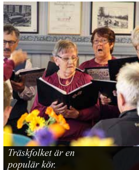
Träskfolket är en populär kör.