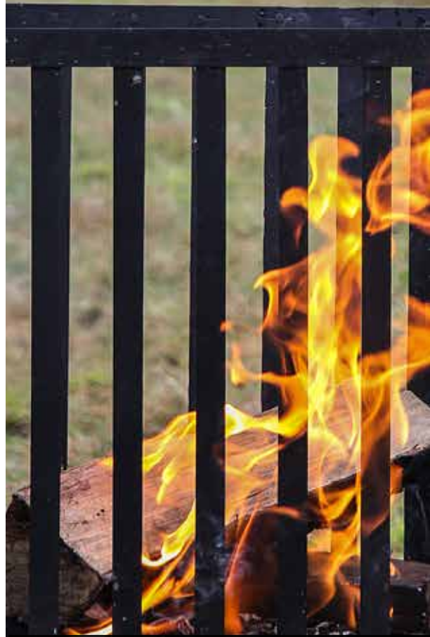
Eldar lyste upp vid varje arrangemang