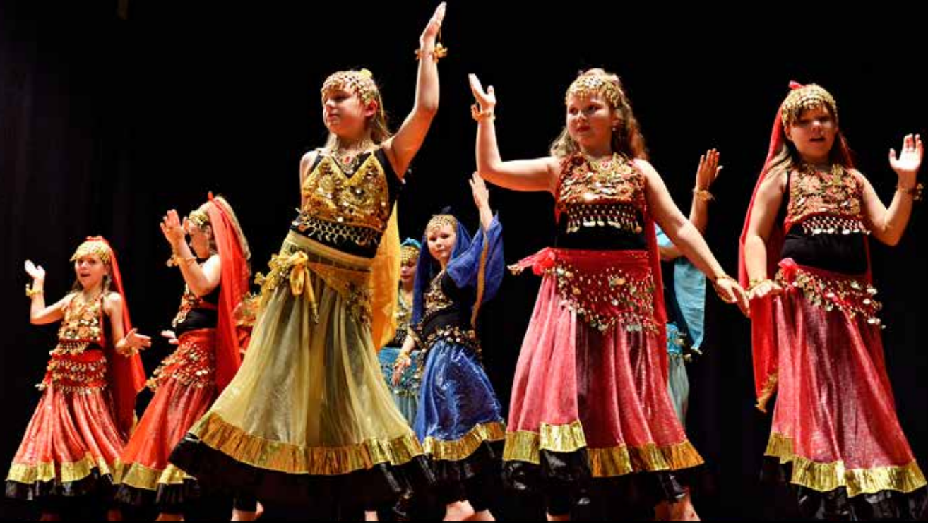
ABF:s barngrupp Bollywood underhåll med indiska danser.