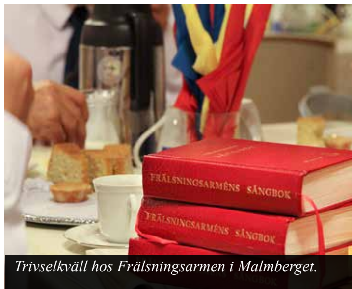
Trivselkväll hos Frälsningsarmen i Malmberget.