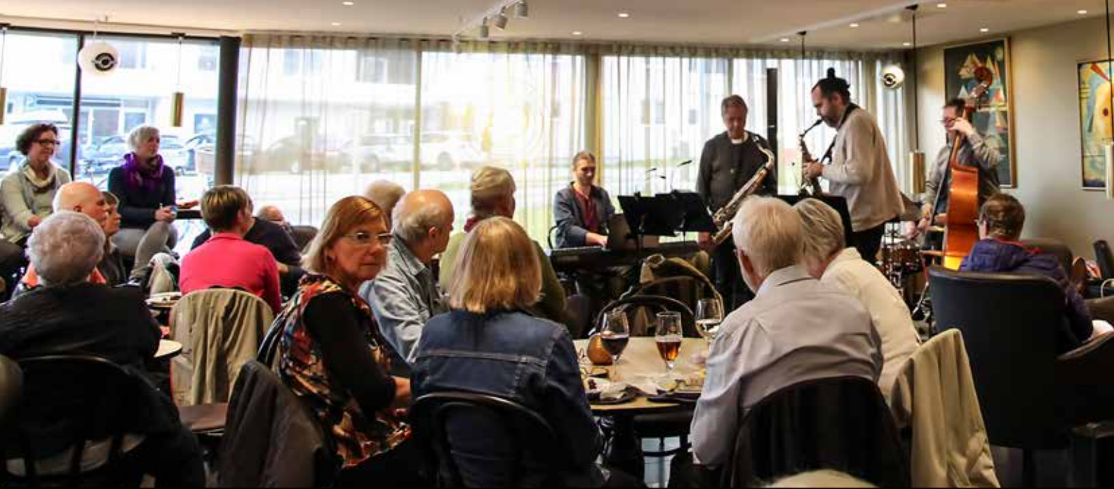
Jamsession i Gällivares nya hotell.