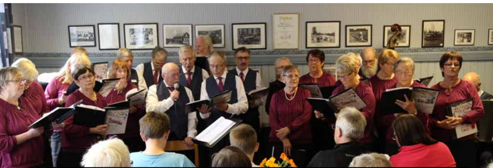
Den populära kören Träskfolket underhöll publiken.