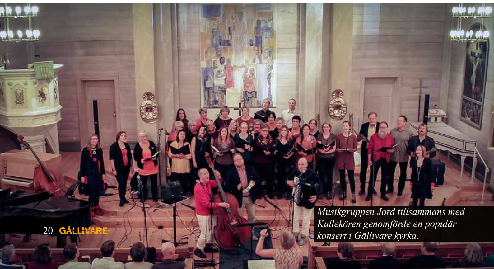
Musikgruppen Jord tillsammans med Kullekören genomförde en populär konsert i Gällivare kyrka.