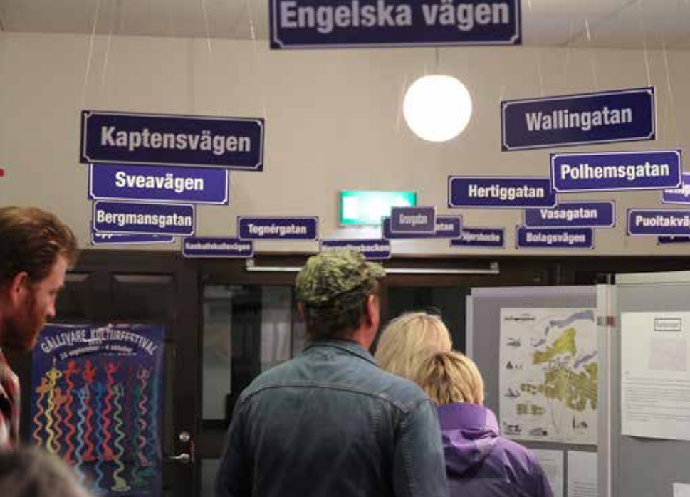
Utställningen om gatunamn väckte stort intresse.