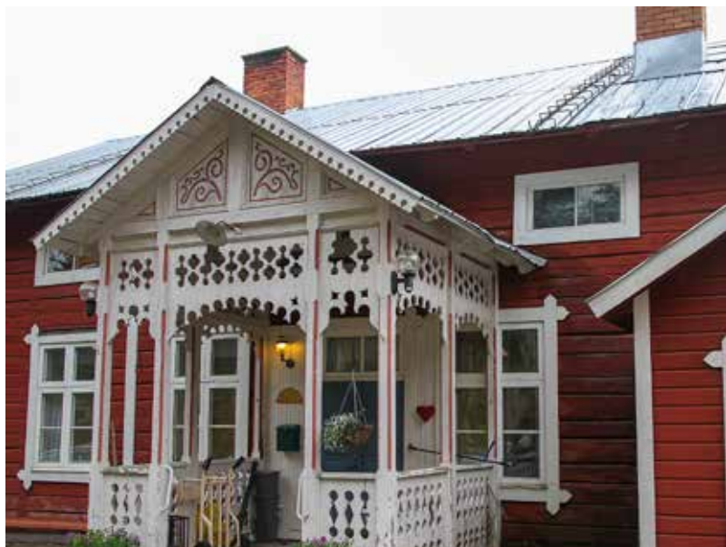
Nattavaaras vackra hembygdsgård.