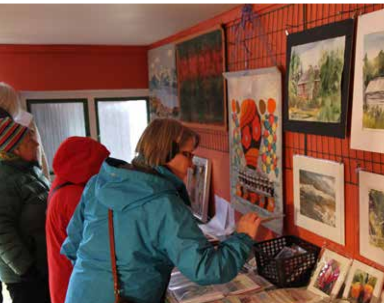
Publiken beundrade konst och hantverk i Purnu.