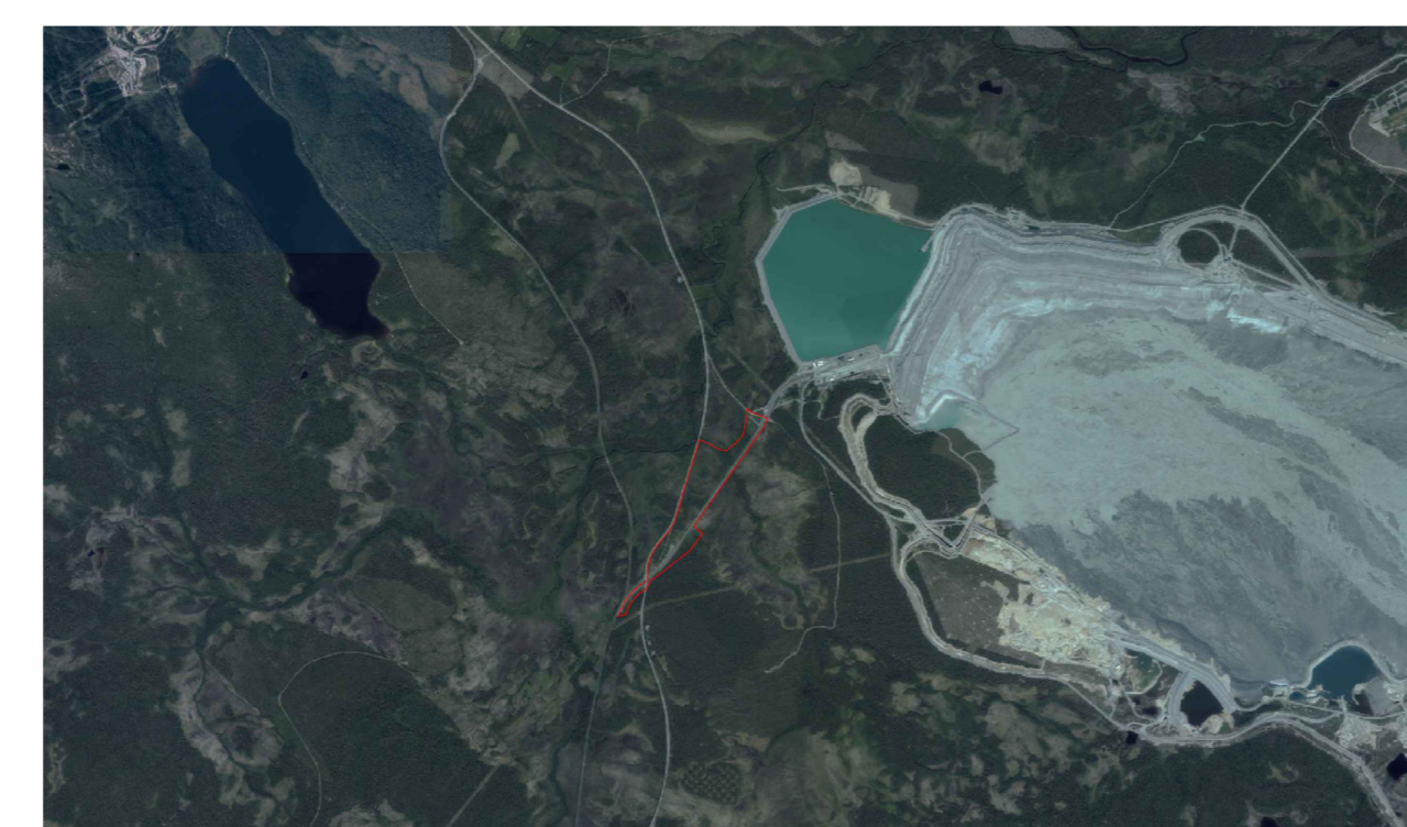
Översiktskarta.